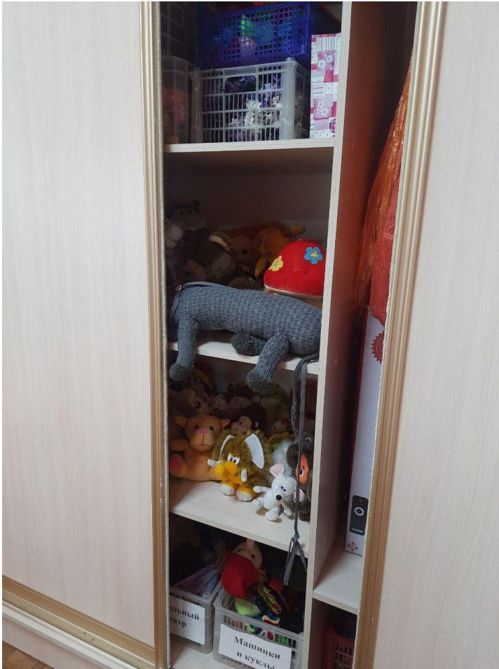
Шкаф встроенный трехстворчатый. Зона для игрушек