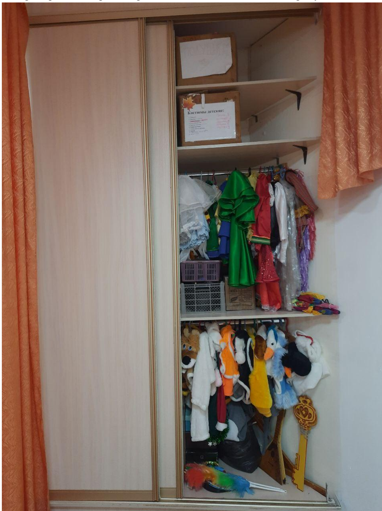
Шкаф встроенный трехстворчатый. Зона для костюмов и атрибутов