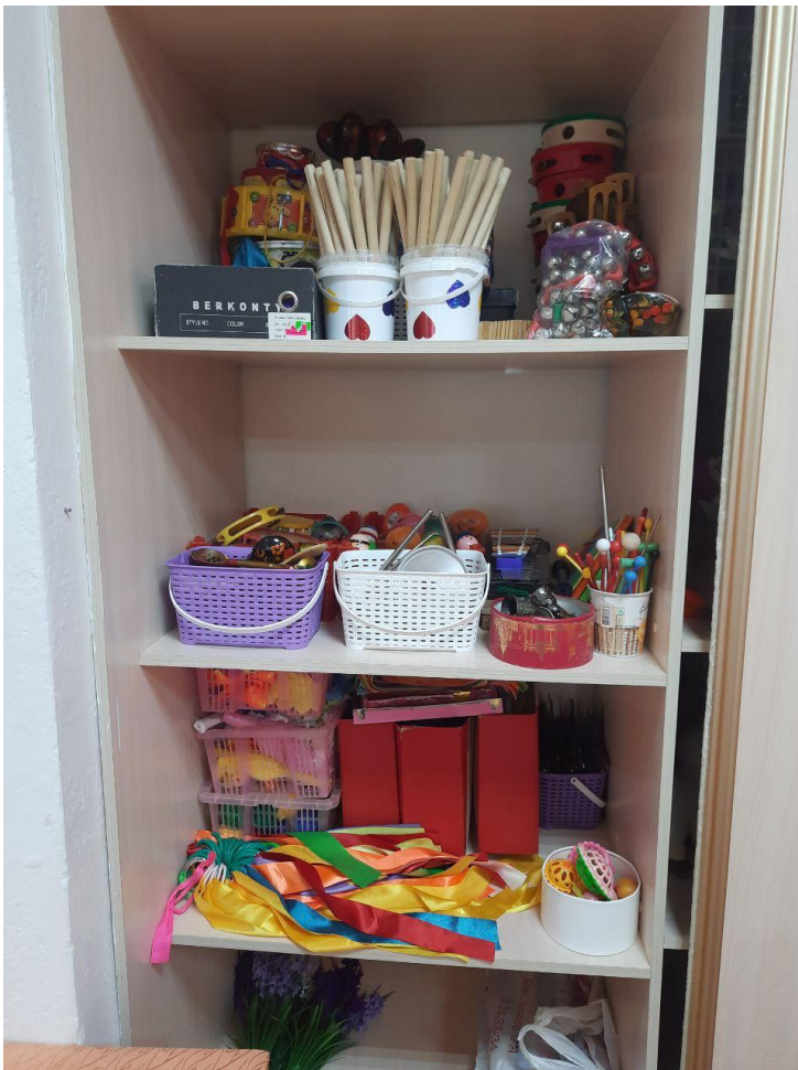
Шкаф встроенный трехстворчатый. Зона для музыкальных инструментов